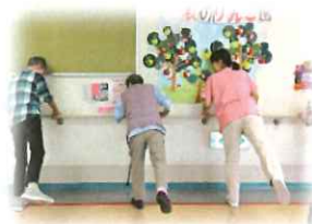
グループ・リハビリ