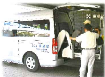
送迎車でお出迎え

私たちスタッフは、特別な場面だけでなく、普段から丁寧な対応に心がけ、家庭的な雰囲気の中で意欲的に過ごしていただけるよう努めています。一部ですが、デイの活動の様子をご覧ください。