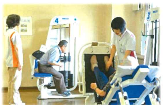
パワーリハビリテーション