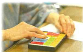
脳活性トレーニング